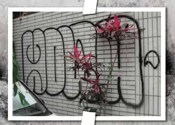
東區占領指數12% 塗鴉印記 HOWA 風格最多元，有簽名、有貼紙、有泡泡字，範圍遍佈大街小巷，能见度最高！