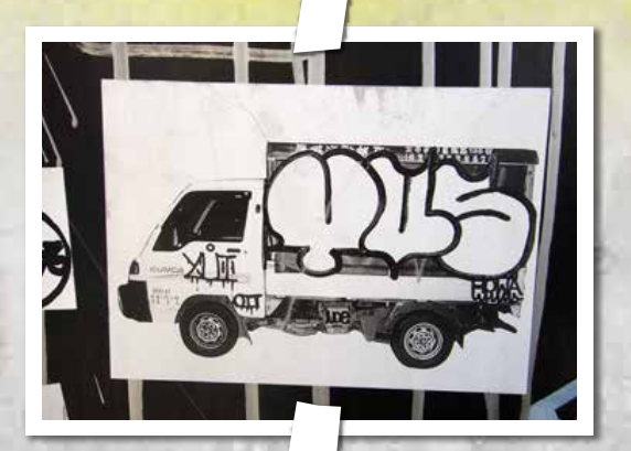
東區占領指數6% 塗鴉印記 YU 多以泡泡字作品見人，常和HOWA之作一同出現，煤媒還發現有張YU的貼紙貼到監視器上，挑戰危險指數破表。